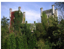
Castillo de Las Caldas / Priorio

categoría de Monumento el 7 de julio de 2007, están sobre el cauce del río Nalón y muy próximas a Priorio, pueblo que dista apenas 10 km de Oviedo. La Lluera está considerada por los expertos como el más completo santuario exterior de arte paleolítico de Europa. Su extraordinaria importancia se debe tanto a la escasez de este tipo de santuarios —la mayoría son interiores— como al magnífico conjunto de grabados, de la época solutrense, que guardan las dos oquedades.