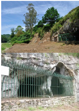
Cueva de La Lluera

Publicado por Cicloturismo - 06 Mar 2016 00:58