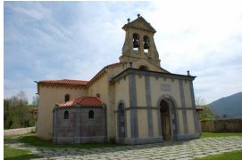
Iglesia de San Juan de Priorio

Después de la visita, nos acercaremos a la iglesia de San Juan de Priorio . La iglesia de San Juan de Priorio, del s. XII - XIII, es una de las más importantes construcciones del románico asturiano.