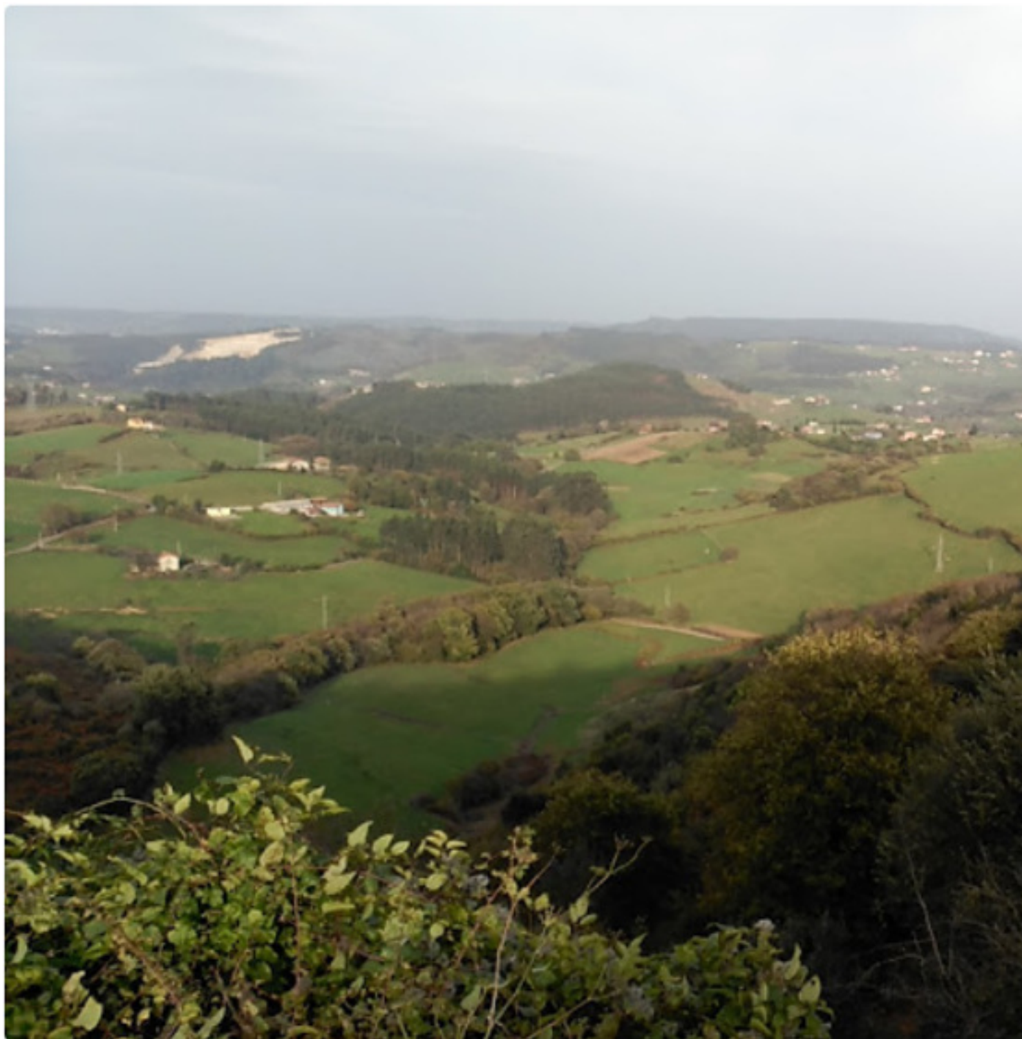
Concejo de Llanera

Publicado por Cicloturismo - 05 Mar 2016 13:52