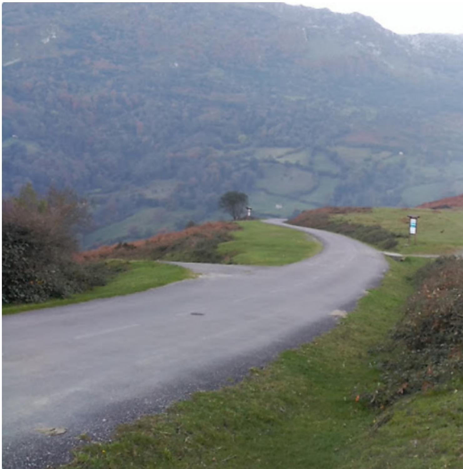
Área recreativa de Viaparé