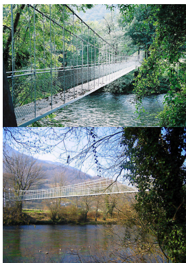
Pasarela sobre el Nalón entre Coto Villanueva y Las Mestas, Salas, Asturias

Al llegar al alto, iniciaremos un divertido descenso y nos encaminamos a Dóriga , donde nos encontraremos con el