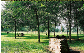
Casa de Llangorio, Llangorio, Asturias