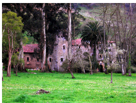
Palacio de Dóriga, Salas, Asturias