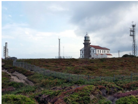
Faro del Cabo Peñas

Cuando lleguemos abajo, encontramos un cruce con la carretera GO-9 donde tomaremos dirección Urbanización para disfrutar un ratín de las frías y tonificantes aguas del mar Cantábrico . Así que, no podemos despreciar un baño si el tiempo lo permite y nos apetece en esta playa de Verdicio