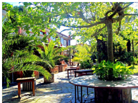
Jardines de La Peñuca, Gijón