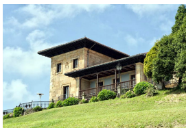
Palacio de La Riega, Gijón