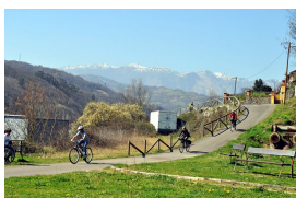
Por las sendas de Turón

8. A 28,51 km Ablaña Aquí pararemos a comer, y realizaremos una pausa de una hora. Se puede comer en un bar de la zona, o en el área recreativa.