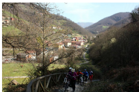
Por las sendas de Turón