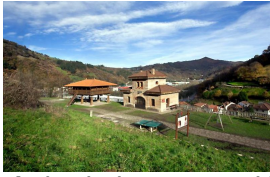
Aula de interpretación del ferrocarril en Lloredo

Publicado por Cicloturismo - 20 Sep 2015 19:00