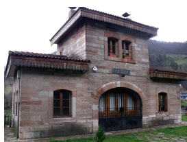
Aula de interpretación del ferrocarril en Lloredo

6. En el Km 46,03, alto de Las Segadas . A continuación tomamos a la derecha hacia La Manjoya , y por la senda de Fusó llegamos al Parque de Invierno (Oviedo, km 51), fin de ruta.