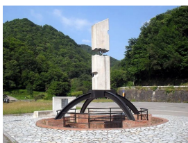
Monolito Pozo Fortuna