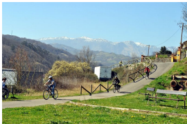
Por las sendas de Turón

8. A 28,51 km Ablaña Aquí pararemos a comer, y realizaremos una pausa de una hora. Se puede comer en un bar de la zona, o en el área recreativa.