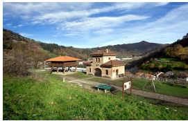
Aula de interpretación del ferrocarril en Lloredo

Publicado por Cicloturismo - 20 Sep 2015 19:00