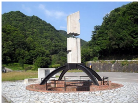
Monolito Pozo Fortuna