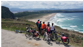
Cicloturistas desde el mirador de Xagón

Publicado por Cicloturismo - 05 Jul 2015 11:00