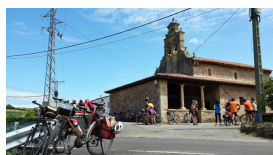
Iglesia de San Jorge de Manzaneda

Dicha frase hace alusión a la mala época que supuso dicho año, pues recordemos que en esas fechas Asturias está en plena guerra de la Independencia a lo que hay que sumar acontecimientos como que el regimiento Asturias combatía con dureza en León. Y aunque seguramente los constructores de la torre no se referían a ello, el 27 de noviembre también muere el ilustrísimo Jovellanos.