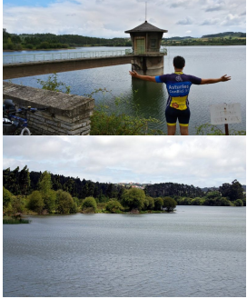
Embalse de La Granda