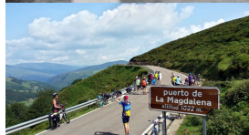
En el puerto de la Magdalena / Matanela