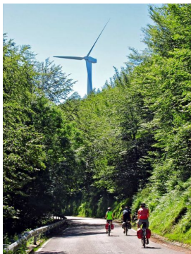
al amanecer, eólicos de La Matanela

Saldremos de Corconte por el mismo sitio que entramos, esto implica deshacer el camino andado el día anterior por la nacional N623 con arcén. En cuanto tomemos el desvío a San Pedro de Romeral (puerto de La Magdalena) los 3 kilómetros iniciales son muy razonables, salvo los primeros 500 metros; el resto son de mero paseo hasta el alto con una subida suave.