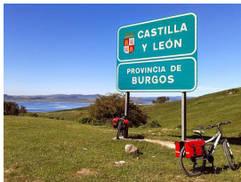
Ebro, a caballo entre Burgos y Cantabria

En el segundo día de ruta recorreremos la distancia que nos separa de Corconte a Renedo, unos 62 kilómetros