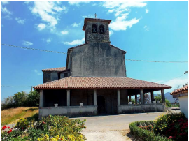
de Nuestra Señora de El Remedio