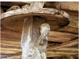
s capiteles de algún que otro hórreo

Hemos intentado diseñar una ruta que pueda adaptarse a todos los públicos, que haya opciones para todos y que por supuesto pasemos un día estupendo disfrutando de nuestra querida amiga la bicicleta ¡Os esperamos!