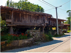
Remedio junto a la bolera y el sendero

, hasta el punto de partida en el Santuario de la Virgen de El Remedio