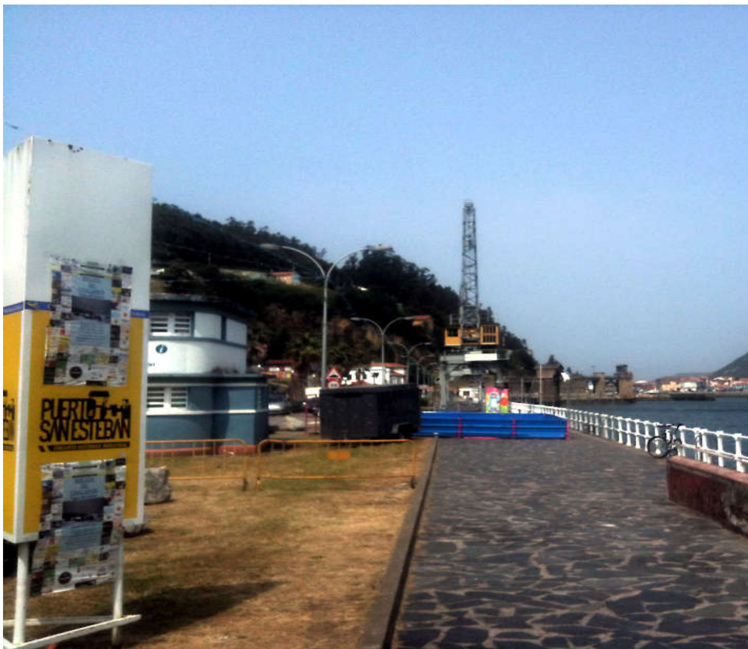
Puerto de San Esteban de Pravia

Después iremos dirección Muros de Nalón y de allí a visitar el mirador y la capilla del Espíritu Santo , bonito balcón sobre el mar y la desembocadura del Nalón.