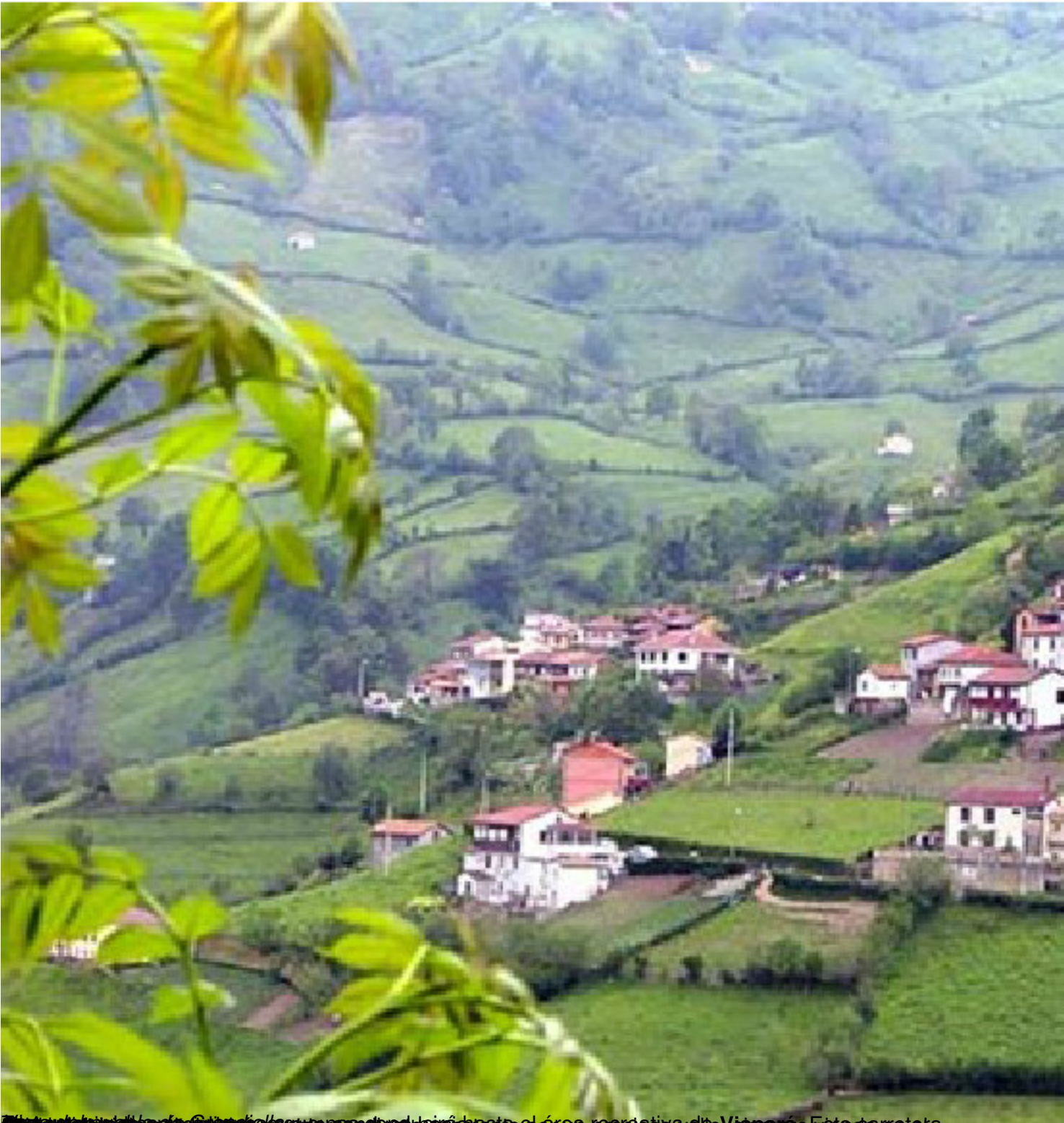
El paisaje desde el mirador de San Andrés hasta el área recreativa de Viapara. Esta carretera,