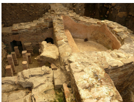
Termas romanas de Santa Eulalia de Valduno