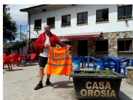
rias ConBici en Casa Orosia