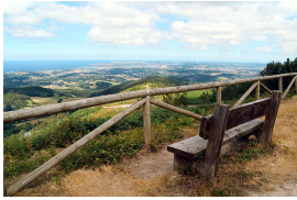
Avilés y Salinas desde el Mirador de Pulide

Publicado por Cicloturismo - 17 May 2015 13:27