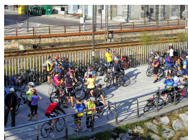
Participantes edición 2013

El horario de salida obedece a que tengamos tiempo a llegar a la visita concertada en dicha gruta a las 13.00 horas y hacer todo con la debida calma y buen ambiente, sin la presión del horario... ¡ya verán merece la pena!