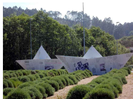
gigantes entre Salinas y Piedras Blancas