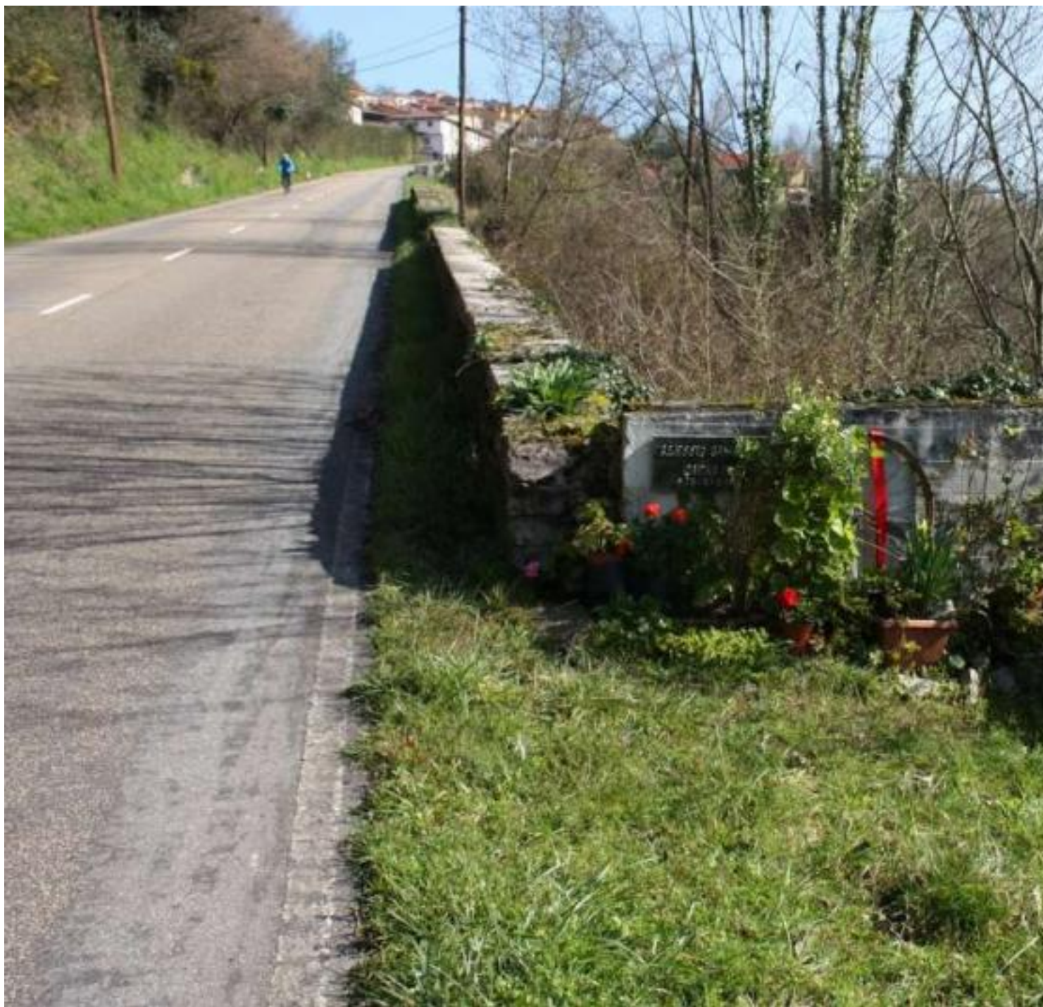
Placa homenaje Alessio Galletti, D.E.P. 2005