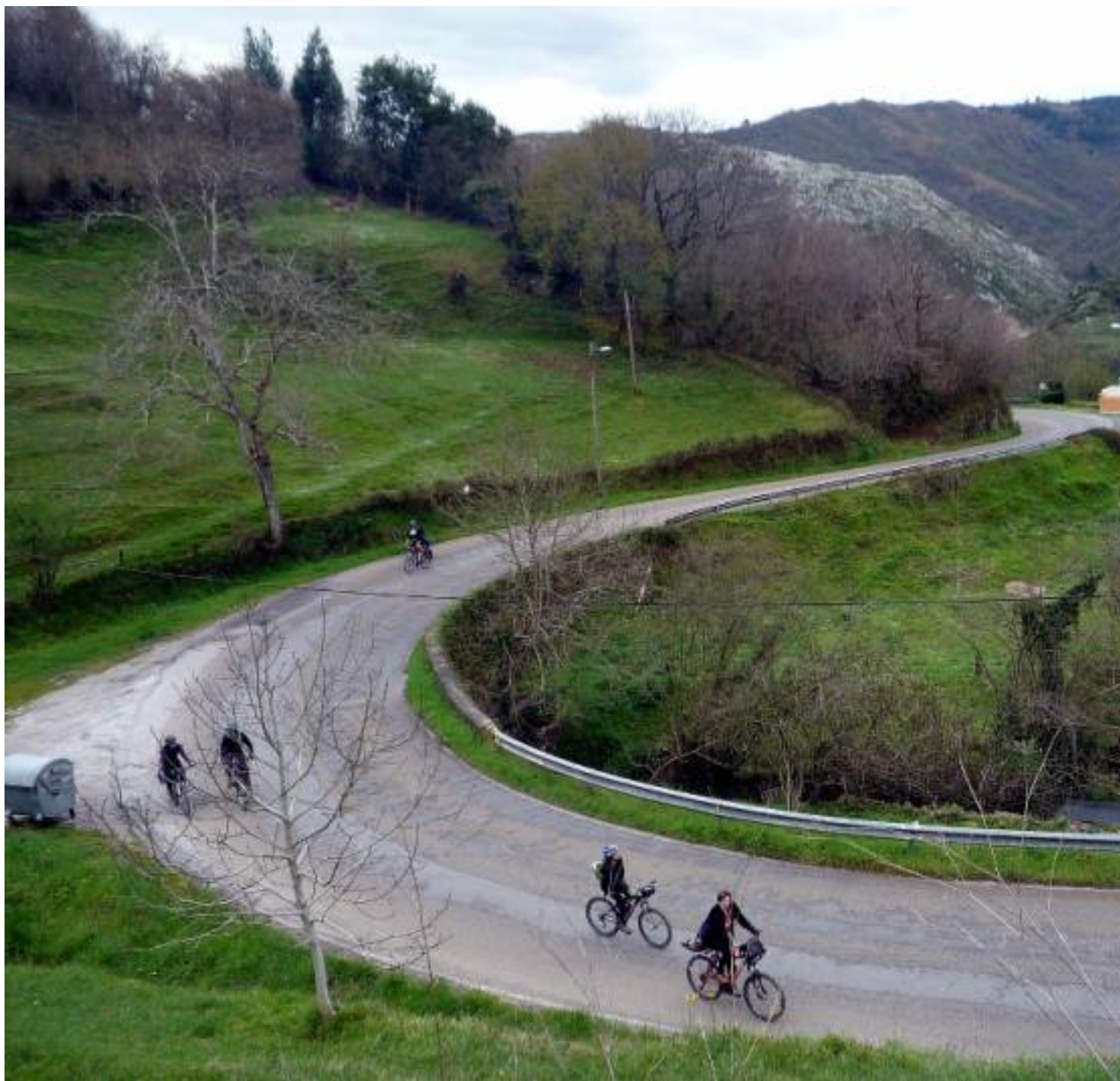
Subiendo hacia Bendones

En las inmediaciones de El Portazgo tomamos la senda verde de Bárcena - Olloniego hasta la entrada del polígono de Olloniego (donde por cierto están los estudios de la TPA). La senda acaba por lo que cogemos la carretera que nos conduce hacia