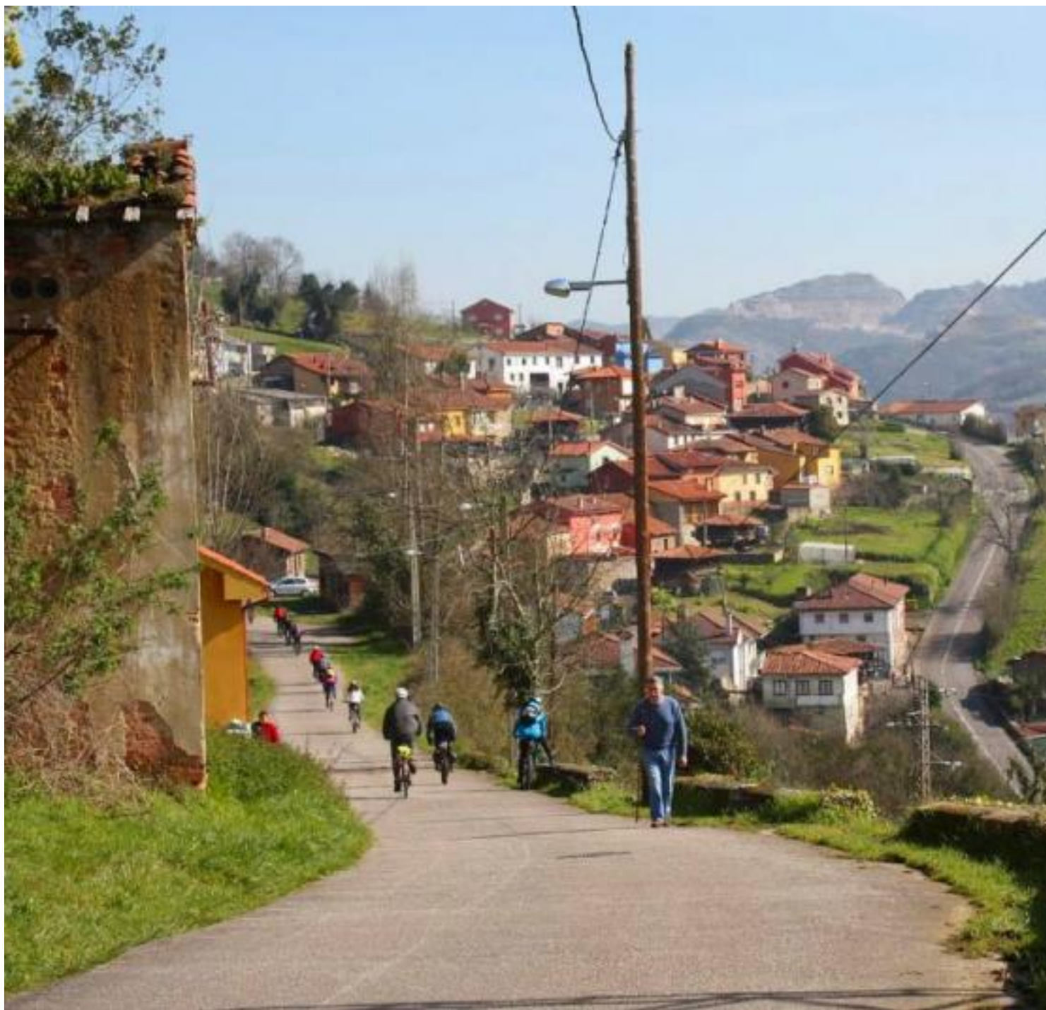
Manzaneda, bajando desde Picuyananza