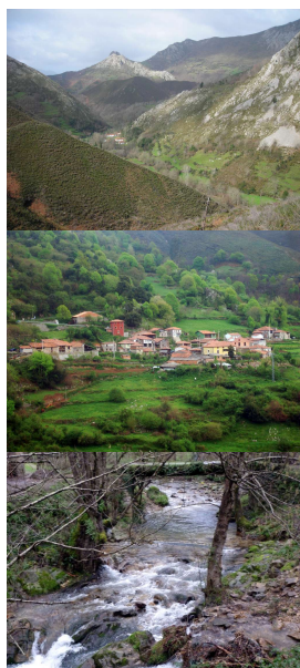
Valle del Zardón, Cangas de Onís