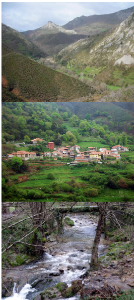
Valle del Zardón, Cangas de Onís