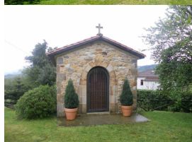
Palacio Vigil-Quiñones de Moral

Ésta ruta eminentemente ciclo-cultural , nos invita a conocer una parte interesante de la arquitectura palaciega en la zona e Siero , así como la pequeña iglesia prerrománica de San Esteban de Aramil de Los Caballeros con algunas curiosas formas.