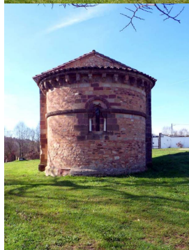
Capilla prerrománica de Aramil de Los Caballeros