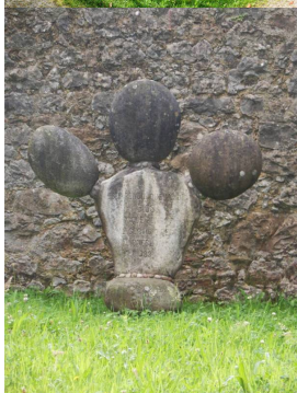
Palacio de Tiroco