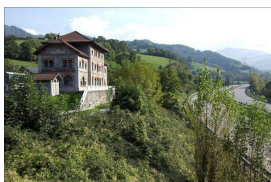
Aula interpretación del prerrománico. La Cobertoria

El resto de la ruta transcurre por senda al lado del río, lo que lo convierte en un cómodo paseo. Dejamos el pueblo de Ujo a la izquierda, al otro lado del río y continuamos hacia Mieres , sin adentrarnos en el casco urbano. Para ello cruzaremos otra vez el río y continuaremos por la senda sin complicaciones, atravesando Ablaña hasta llegar a La Pereda .