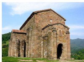
Santa Cristina de Lena