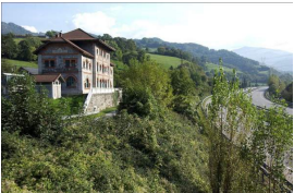
Aula interpretación del prerrománico. La Cobertoria

El resto de la ruta transcurre por senda al lado del río, lo que lo convierte en un cómodo paseo. Dejamos el pueblo de Ujo a la izquierda, al otro lado del río y continuamos hacia Mieres , sin adentrarnos en el casco urbano. Para ello cruzaremos otra vez el río y continuaremos por la senda sin complicaciones, atravesando Ablaña hasta llegar a La Pereda .