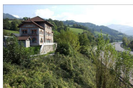
Aula interpretación del prerrománico. La Cobertoria

El resto de la ruta transcurre por senda al lado del río, lo que lo convierte en un cómodo paseo. Dejamos el pueblo de Ujo a la izquierda, al otro lado del río y continuamos hacia Mieres , sin adentrarnos en el casco urbano. Para ello cruzaremos otra vez el río y continuaremos por la senda sin complicaciones, atravesando Ablaña hasta llegar a La Pereda .