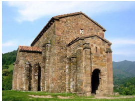
Santa Cristina de Lena