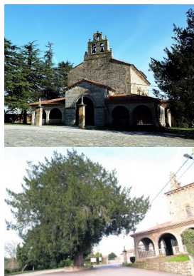
e San Juan Bautista en Cenero