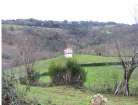
Solitaria Ermita de San Ananías (Huergo)