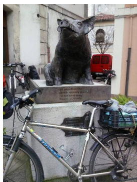
El Gochín de Noreña

** ¡¡Recomendada para ciclistas noveles!!