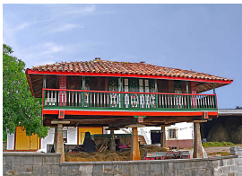
Panera en Cenero

¡Quien venga, tendrá que besar al gochín en el morrín!