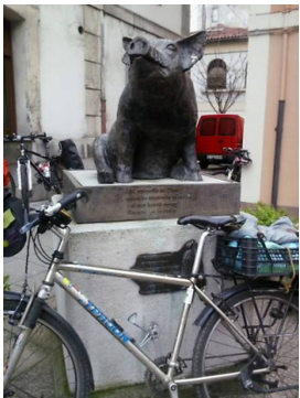
El Gochín de Noreña

** ¡¡Recomendada para ciclistas noveles!!