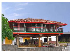
Panera en Cenero

¡Quien venga, tendrá que besar al gochín en el morrín!