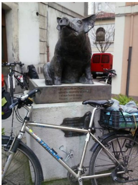
El Gochín de Noreña

** ¡¡Recomendada para ciclistas noveles!!