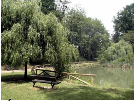
Área recreativa de Santa Bárbara, Lugones

Publicado por Cicloturismo - 15 Mar 2015 22:00