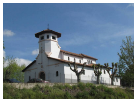
Iglesia de Santa Eulalia, Colloto

Esta excursión de cicloturismo es lineal, con inicio y fin en diferentes puntos; es llana, muy fácil de pedalear y apta para todo tipo de bicicletas.