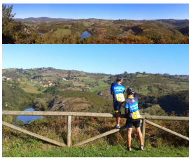
El Nora a su paso por Priañes

. Por lo demás un paseo, prácticamente llano. Los pocos desniveles son perfectamente pedaleables sin mayores complicaciones.