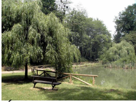
Área recreativa de Santa Bárbara, Lugones

Publicado por Cicloturismo - 15 Mar 2015 22:00