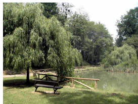
Área recreativa de Santa Bárbara, Lugones

Publicado por Cicloturismo - 15 Mar 2015 22:00