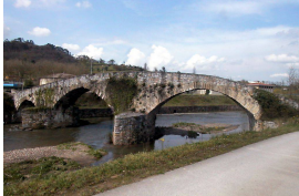
El puente Romanón o Puente Viejo, Lugones

Volviendo a nuestra ruta, el Puente Romanón o Puente Viejo cerca de Lugones, medieval con tres