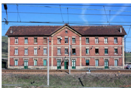
«Casones» Antigua residencia de empleados ferroviarios

Hasta la inauguración de la línea León-Gijón, Villabona fue una aldea formada por seis caserías y el palacio de los Alonso de Villabona , del siglo XVII, cuyos propietarios vendieron los terrenos necesarios (4 hectáreas) para la construcción de la estación. Ésta fue puesta en marcha con el ramal Villabona-San Juan de Nieva, construido para facilitar la salida de los carbones de Santofirme y Ferroñes. En las proximidades de la estación se puede visitar el símbolo representativo de esta minería: el castillete del pozo San Ismael , último que queda en Asturias de la extracción de fluorita.