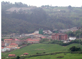
Vista de Villabona a través del valle del río Frade

Publicado por Cicloturismo - 07 Mar 2015 09:30