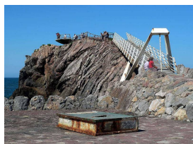
Esculturas del Museo de Las Anclas (Salinas-Arnao)

Llegaremos a la Playa de Arnao , donde podremos visitar el Museo de la Minería , en lo que antaño fue una mina de carbón cuyas galerías submarinas recorrió allá por 1858, la reina Isabel II, que se alojaba en el palacio del