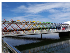
Puente de Colores del Niemeyer (Avilés)