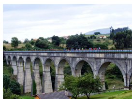
Ciclando el acueducto de Ensidesa