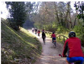
Por la senda del Piles

de Ramón Muriedas (1970) en la que la Madre mira al mar, hacia el que alcanza desgarradóramente una de sus manos y con la que Muriedas intentó plasmar en ella el sufrimiento de tantas asturianas y gijonesas que vieron como sus hijos debían partir en busca de una vida mejor.