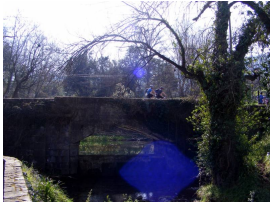
En el Lavaderu de Deva