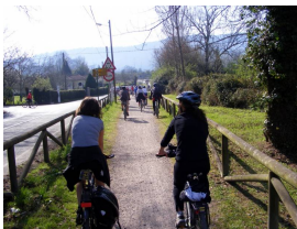
llegando a Deva por la senda de Peñafrancia

El itinerario se define en dos bucles , que hacen de esta ruta ampliamente configurable de medio día o para pasar el día entero. De unos 49 km, el primer bucle va de Gijón hasta El Rinconín pasando por las sendas de Deva y Peñafrancia con una distancia de 27 km para quienes deseen tan solo hacer medio día, y un segundo bucle que iría desde El Rinconín a Gijón pero esta vez por la senda del Piles y de La Camocha y que consta de 22 km.