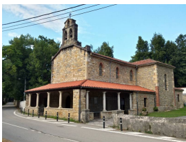
Iglesia de San Salvador