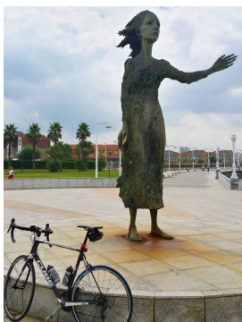
Madre del Emigrante

Una vez repuestas las fuerzas comenzaremos el segundo bucle en el paseo de El Rinconín para dirigirnos de nuevo por la senda del río Piles hasta enlazar con la senda de La Camocha , antigua vía de ferrocarril minero que comunicaba los pozos de La Camocha con Veriña.