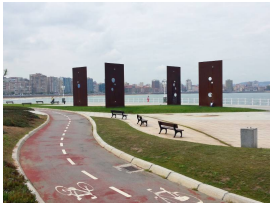
Sombras de Luz. Carril-bici de El Rinconín