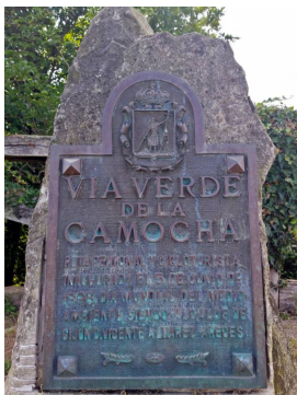
Placa V.V. La Camocha