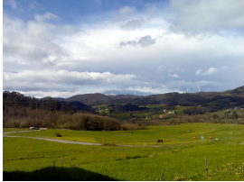
Las Regueras, dominios del viento