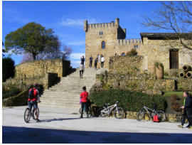
En la Torre Valdés (San Cucao de Llanera)