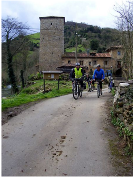
Palacio-Torre de Villanueva de Grado

Publicado por Cicloturismo - 22 Feb 2015 11:00