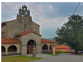
Abadía de San Juan Bautista

—algo tendrán sus aguas si es donde la gente de Pruvia, parte de la de La Barganiza así como ciertos de Lugones viene a coger agua para beber en sus casas—.