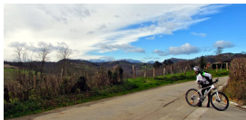
Vistas hacia el Aramo desde Pando (Valdesoto)