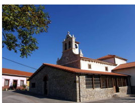
Iglesia de San Miguel de Serín