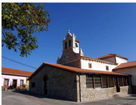
Iglesia de San Miguel de Serín