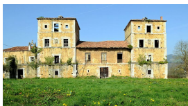
Palacio de Villanueva

—en la actualidad, El Castillo de San Cucao—. Es un conjunto monumental y sobrio, formado por una torre y un cuerpo rectangular adosado a la misma que la prolonga hacia el norte. Tiene su origen en una torre cuadrada medieval, mandada construir en el siglo XIV (hacia el año 1393) por Diego Menéndez de Valdés, el Mayor (miembro de esta poderosa e influyente familia); hoy se conserva solamente su estructura general y, al parecer, una pequeña ventana geminada del último piso en la que se talla un escudo, que según F. Sarandeses, presenta las armas de Valdés, Castilla y León y Bernaldo de Quirós, así como la tronera con forma de bocallave situada bajo ella. La torre y el cuerpo rectangular se reformaron en numerosas ocasiones (la última en 1989), dando lugar a la construcción actual, cuya mayor parte parece corresponder a los siglos XIX y XX. Así, la torre, que tiene plantas, reemplazó principios del s. XX su cubierta de teja a cuatro vertientes por un remate almenado con garitones cilíndricos en sus ángulos; el cuerpo adosado, con dos plantas y desván, culmina de igual modo. Grandes vanos goticistas con arco apuntado rasgan los muros tanto de la torre como del cuerpo rectangular.