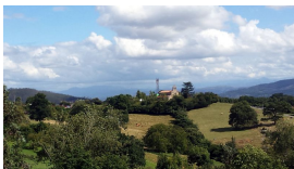
Iglesia de San Nicolás de Bonielles