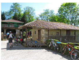
Molín de la Enceña

De El Berrón a Meres ya no hay pista sino que se pedalea por carreteras secundarias. En los 4 kilómetros sin apenas tráfico —pero al fin y al cabo, carretera— donde deberemos extremar precauciones, nos sorprenderá lo colorido de algunos chalets.