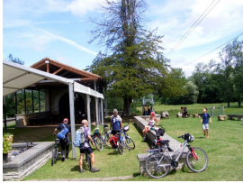
Santuario Virgen de la Cabeza, Meres