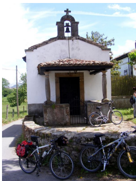
María Faes, La Carrera (Siero)

En Pola de Siero , tras una breve pero dura subida, enlazaremos con una pista que nos conducirá hasta El Berrón. En el camino nos encontraremos con el caserón y la capilla de María Faes así como con tres enormes perros San Bernardo custodiando de una finca debidamente vallada.