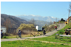
Por las sendas de Turón

8. A 28,51 km Ablaña Aquí pararemos a comer, y realizaremos una pausa de unas 2 horas. Se puede comer en un bar de la zona, o en el área recreativa.