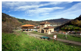
Aula de interpretación del ferrocarril en Lloredo

Publicado por Cicloturismo - 21 Sep 2014 19:00