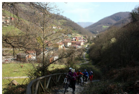
Por las sendas de Turón