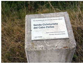
Senda cicloturista Luanco - Cabo Peñas

Publicado por Cicloturismo - 07 Sep 2014 17:00