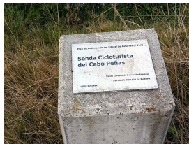
Senda cicloturista Luanco - Cabo Peñas

Publicado por Cicloturismo - 07 Sep 2014 17:00