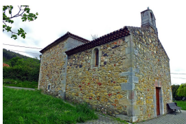
Ermita de Los Remedios