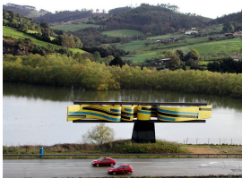
“El Cuélebre” vigía del embalse de Tacones

Ya por la carretera AS-326 y a través de la acería de ZALIA , llegaremos a la parte alta del polígono de Tremañes (PK.37) para otra vez el carril-bici del parque de Moreda llegar al punto de partida, cerrando así la ruta circular.