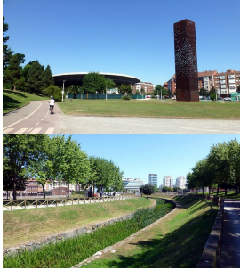
Por el parque de Moreda

Os presentamos una ruta cicloturista con inicio y fin en el mismo punto y que transcurre en su mayoría por el Camino de Santiago, aunque también nos hace pedalear por vías verdes como la del “Ferrocarril Estratégico”, carreteras secundarias y, por ciudad, carriles-bici que nos hará despreocuparnos del tráfico.