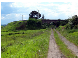
Por los túneles del ferrocarril estratégico