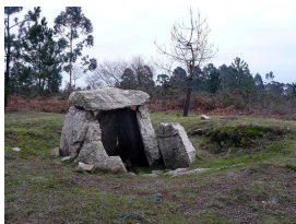
Dólmen tumultular en Monte Areo