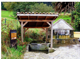
Fuente de Merún

Teniendo a nuestra izquierda el Monte La Llana en primera instancia y luego el Monte Areo , empezaremos a subir por la carretera CE-6 llegando la localidad carreñense de