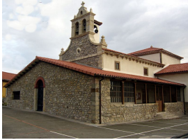
Iglesia de San Miguel de Serín