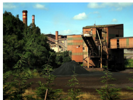
Siderurgia en Veriña

Publicado por Cicloturismo - 16 Ago 2014 19:57