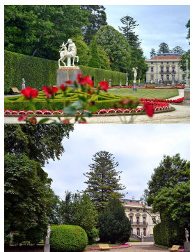
Quinta de Los Selgas

la ruta sigue por dicho Camino del Norte y que nos llevará casi hasta los pies de la zona alta de Cudillero