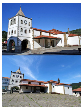
Iglesia de Santa María en Soto de Luiña

La Quinta de Los Selgas —considerada como el monumento civil más importante y uno de los mejores conservados de Asturias gracias a conservar casi intacta su decoración original— es un conjunto de palacio y finca ajardinada que se remonta al finales del siglo XIX. Al palacio y pabellón de tapices —de estilo renacentista italiano— le precede un amplio pasillo de jardines cuyo paradigma es Versalles —en el año 2006 recibieron el premio al mejor jardín Español de mano de la Sociedad de Amigos del Real Jardín Botánico—, donde se exponen obras que ocasionalmente cede el Museo de El Prado. En él podremos contemplar máximas tales como Aníbal vencedor (Goya), contempla por primera vez Italia desde los Alpes