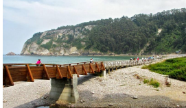
Pedaleando por la Concha de Artedo