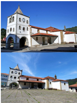
Iglesia de Santa María en Soto de Luiña

La Quinta de Los Selgas —considerada como el monumento civil más importante y uno de los mejores conservados de Asturias gracias a conservar casi intacta su decoración original— es un conjunto de palacio y finca ajardinada que se remonta al finales del siglo XIX. Al palacio y pabellón de tapices —de estilo renacentista italiano— le precede un amplio pasillo de jardines cuyo paradigma es Versalles —en el año 2006 recibieron el premio al mejor jardín Español de mano de la Sociedad de Amigos del Real Jardín Botánico—, donde se exponen obras que ocasionalmente cede el Museo de El Prado. En él podremos contemplar máximas tales como Aníbal vencedor (Goya), contempla por primera vez Italia desde los Alpes