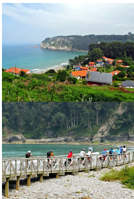
Pedaleando por la Concha de Artedo