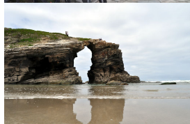
Playa de Las Catedrales