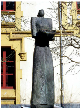
Estatua homenaje a las avellaneras, Infiesto

y de ahí por carretera local hasta la playa donde nos daremos un merecido chapuzón aprovechando también para comer de bocata o, el que quiera, de menú.