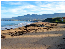
Playa de La Isla, Colunga

La vuelta desde La Isla será por la misma carretera y es el tramo que presenta mayor dificultad, sobre todo los 5 kilómetros antes de llegar al alto (con una pendiente media en torno al 5,8%), pasado Libardón , por