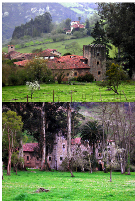
Palacio de Dóriga, Salas, Asturias

Bonita ruta que discurre, primeramente, entre altos y valles desde los que se divisan paisajes impresionantes. Partiremos de Grado hacia el alto de Cabruñana . Son los primeros 7 km pero, aviso para navegantes, cuesta los suyos, sin ser tampoco rampas tremendas. El resto de la ruta es totalmente amable de pedalear, salvo un corto tramo de escaleras que hay que bajar a pie.