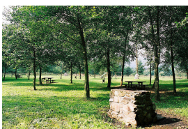
Parque fluvial del Salmón, Cornellana, Asturias