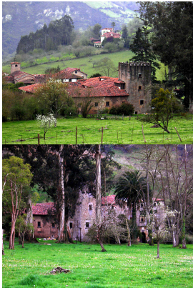
Palacio de Dóriga, Salas, Asturias

Bonita ruta que discurre, primeramente, entre altos y valles desde los que se divisan paisajes impresionantes. Partiremos de Grado hacia el alto de Cabruñana . Son los primeros 7 km pero, aviso para navegantes, cuesta los suyo, sin ser tampoco rampas tremendas. El resto de la ruta es totalmente amable de pedalear, salvo un corto tramo de escaleras que hay que bajar a pie.