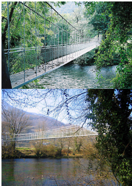
Pasarela sobre el Nalón entre Coto Villanueva y Las Mestas, Salas, Asturias

Al llegar al alto, iniciaremos un divertido descenso y nos encaminamos a Dóriga , donde nos encontraremos con el