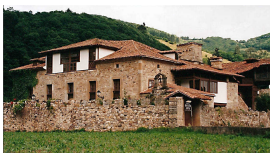
Casa de Longoria, Laneo, Asturias

eran entonces más cortas, sobrevivían más tiempo y podían desovar en los ríos dos o más años consecutivos, según una reciente y singular investigación.