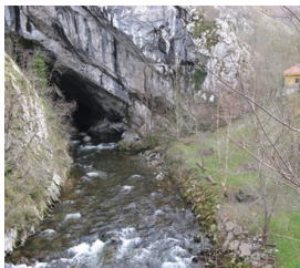
Cueva de Devoyu

Publicado por Cicloturismo - 25 May 2014 21:50