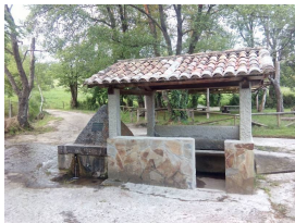
Fuente-lavadero de El Forcáu