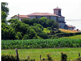
El Santuario destacando en el núcleo de El Remedio

Como decíamos, paralelos a la N-634 llegaremos a Lieres para callejeando poco a poco alcanzar nuestro destino: “ El Remedio ”. Está calculado llegar aproximadamente a las 15.00 de la tarde por lo que es importante llevar avituallamiento (provisiones, agua, comida) y comer en las paradas que se harán, como la del Palacio de Meres, pero ninguna en un bar.