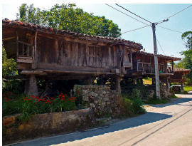
Remedio junto a la bolera y el sendero