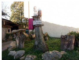
Curioso cartel "Se Busca Novio" en el sendero de El Remedio

Publicado por Cicloturismo - 11 May 2014 14:04