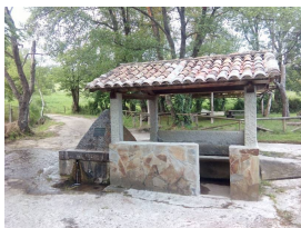
Fuente-lavadero de El Forcáu