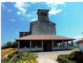
de Nuestra Señora de El Remedio