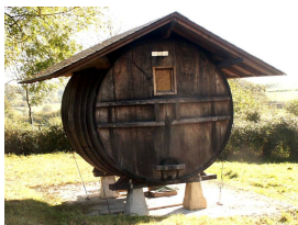
Barril de sidra restaurado