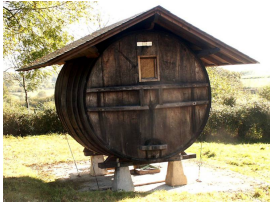
Barrel de sidra restaurado