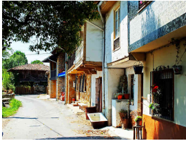
Callejeando por El Remedio