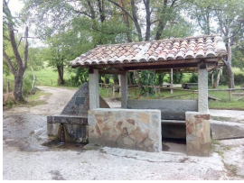
Ante-lavadero de El Forcáu