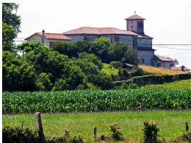
El Santuario destacando en el núcleo de El Remedio

Como decíamos, paralelos a la N-634 llegaremos a Lieres para callejeando poco a poco alcanzar nuestro destino: “ El Remedio ”. Está calculado llegar aproximadamente a las 15.00 de la tarde por lo que es importante llevar avituallamiento (provisiones, agua, comida) y comer en las paradas que se harán, como la del Palacio de Meres, pero ninguna en un bar.