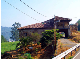
Palacio de Los Francos, Quinzanas (Pravia)