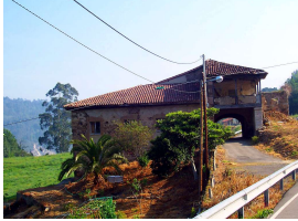
Palacio de Los Francos, Quinzanas (Pravia)